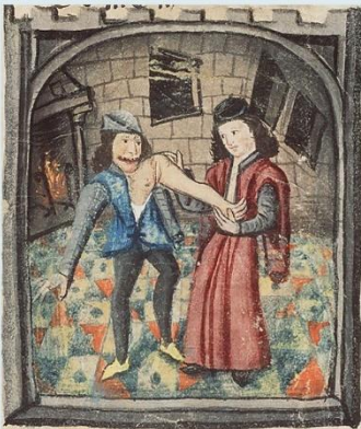
Вправление вывихнутого плеча. Миниатюра XV в.

В Средние века людей высших сословий лечили врачи, имеющие медицинское образование, полученное в университетах. Простых же горожан лечили цирюльники.